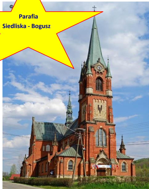
Parafia Siedliska - Bogusz