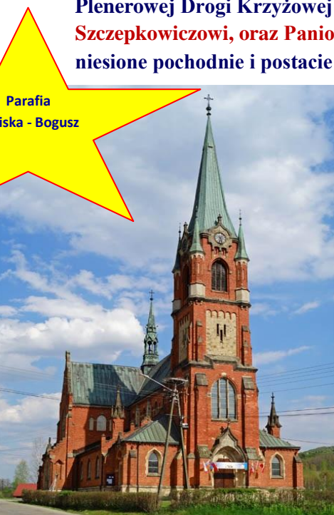
Parafia Siedliska - Bogusz