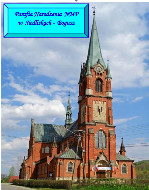
Parafia Narodzenia NMP w Siedliskach - Bogusz