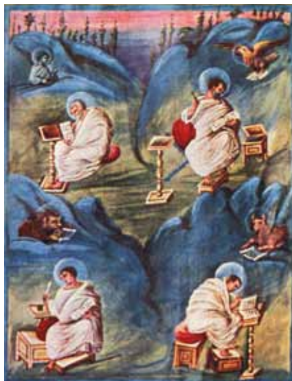
Ewangelista z atrybutami, Biblia karolińska, IX w., Rzym, Włochy